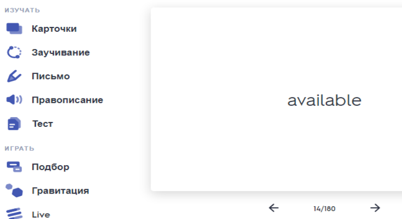
Рис. 4. Пример интерактивных карточек, созданных на сайте https://quizlet.com

карточка является озвученной, что позволяет обращать внимание на фонетический аспект речи. Многие учителя создают в Quizlet марафоны, интерактивные онлайн классы, занятия.