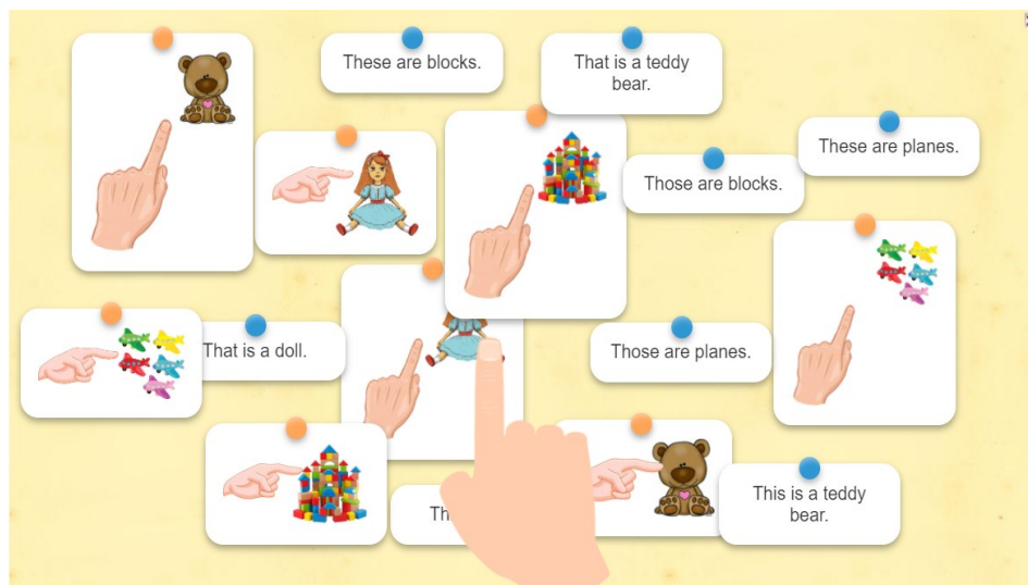
Рис. 1. Пример авторского упражнения на тему “Demonstrative pronouns”, созданного на сайте https://learningapps.org/display?v=p796bbm1n20 .

пропусков, 8) аудио (видео) контент и др. На сайте существует возможность создания интерактивных игр, такие как: 1) «Кто хочет стать миллионером», 2) «Парочки», 3) «Скачки», 4) «Слова из букв» и др. Кроме того, существует возможность создания интерактивных классов и координации процесса обучения онлайн.