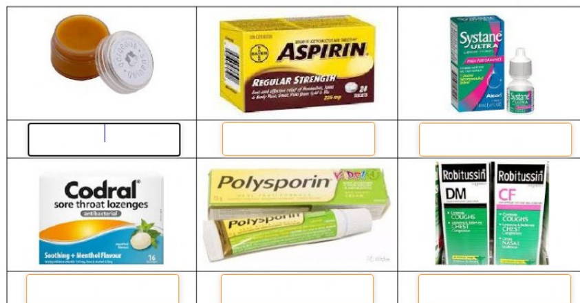
Рис. 3. Пример интерактивного упражнения с сайта Liveworksheets ( https://www.liveworksheets.com/ro1374350ln )

Fill in the blanks with the words in the word bank.