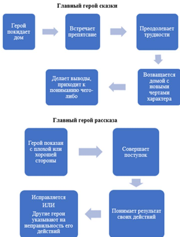
Рис. 2. Памятка «Главный герой произведения»