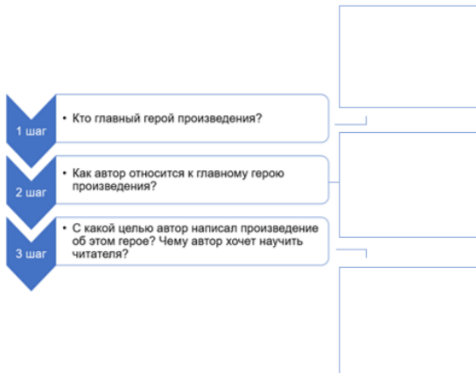
Рис. 4. Памятка «Главная мысль произведения»

В качестве дополнительного творческого задания после работы с каждым произведением мы предлагаем посетить вместе с младшими школьниками музеи родного края, ботанические сады, театральные постановки для углубления понимания содержания прочитанных произведений.