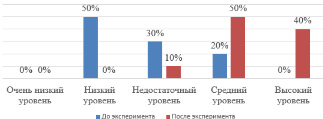
Рис. 1 Распределение испытуемых по уровням связной речи до и после формирующего эксперимента, % (по методике В.П. Глухова)

На рисунке 1 отражены сравнительные результаты уровня связной речи у детей старшего дошкольного возраста с ОНР III уровня до и после проведения формирующего эксперимента, по методике В.П. Глухова.