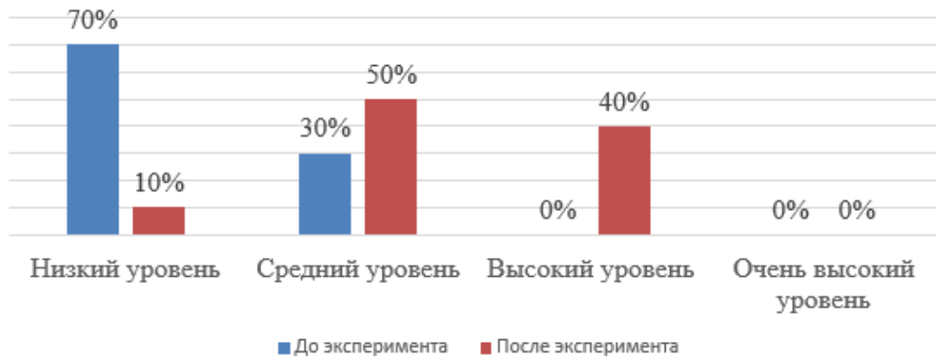
Рис. 2 Распределение испытуемых по уровням связной речи до и после формирующего эксперимента, % (по методике Т.А. Фотековой) контрольном этапе исследования по методике Т.А. Фотековой, %

На рисунке 3 также отражены сравнительные результаты констатирующего и контрольного исследования связной речи у детей старшего дошкольного возраста с ОНР III уровня по методике И.В Прищеповой, С.В. Недоленко.